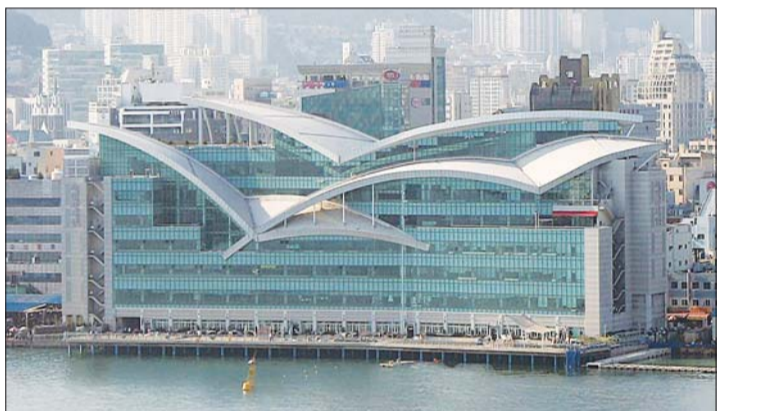
갈매기 형상의 자갈치시장 건물.

'자갈치시장' 하면 자갈치아지매가 먼저 떠오른다. '자갈치아지매'는 자갈치시장에서 장사를 하고 있는 아주머니들을 지칭하는 말이지만 부산MBC라디오의 최장수 프로그램이기도 하다. 이것을 창안한 이는 김민부 PD였다. 그는 시인으로서도 유명하지만 '기다리는 마음'의 작사자로도 널리 알려져 있는 요절한 천재 시인이었다. 이 프로가 투박한 경상도 사투리로 가려운 곳을 시원히 긁어주자 인기가 폭발했고 지금도 꾸준히 방송되고 있다. 자갈치시장은 부산을 상징하는 대표적인 브랜드 가운데 하나다. 그래서 전국적으로 잘 알려진 명소가 되었고 국내 뿐 아니라 외국인 관광객들에게 알려진 명물이다. 자갈치시장이라면 으레 수산물시장 쯤으로 생각하기 쉽다. 그러나 이곳엔 서민들의 애환이 서린 전통시장, 재래시장 역할을 하면서 정겨운 분위기를 풍겨주는 곳이다. 새롭게 들어