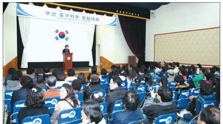
한자녀 더 갖기 운동연합 발대식이 4월 23일 구청 대회의실에서 개최됐다. 이날 많은 주민들이 참석해 발대식을 축하했다.