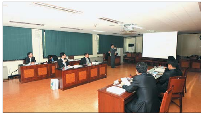
웅두산 자갈치 관광특구 활성화 추진사항 평가가 5월 4일 구청 중회의실에서 열려 참석자들이 열띤 토론을 펼쳤다.