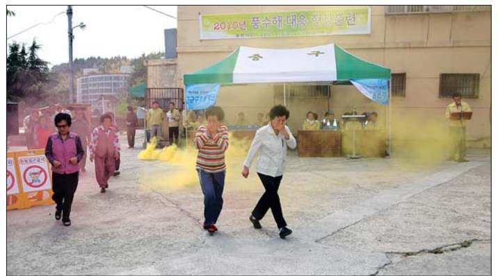
2010년 풍수해 대응 현장훈련이 5월 15일 시민아파트에서 열려 주민들이 대피 훈련을 했다.