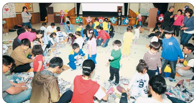
5월 7일 노들담 어린이집 아동과 학부모 150여명이 '놀이학교'에서 즐거운 시간을 보내고 있다.

양육에 대한 아빠의 역할을 제고시키고 출산분위기를 확산시키기 위해 시작한 '아빠와 함께하는 놀이학교'가 큰 호응을 얻고 있다. 5개 어린이집 원아 및 아빠, 그 외 가족들 870명이 참석하여 구청 지하대회의실에서 즐거운 시간을 보냈다. 아빠와 자녀의 신체놀이, 신문지나 박스를 이용한 도구놀이를 통하여 아빠들은 자녀들과 재미있고 즐거운 시간을 보낼 수 있는 방법을 터득하였고 가족관계도 친밀해지는 계기가 되었다.