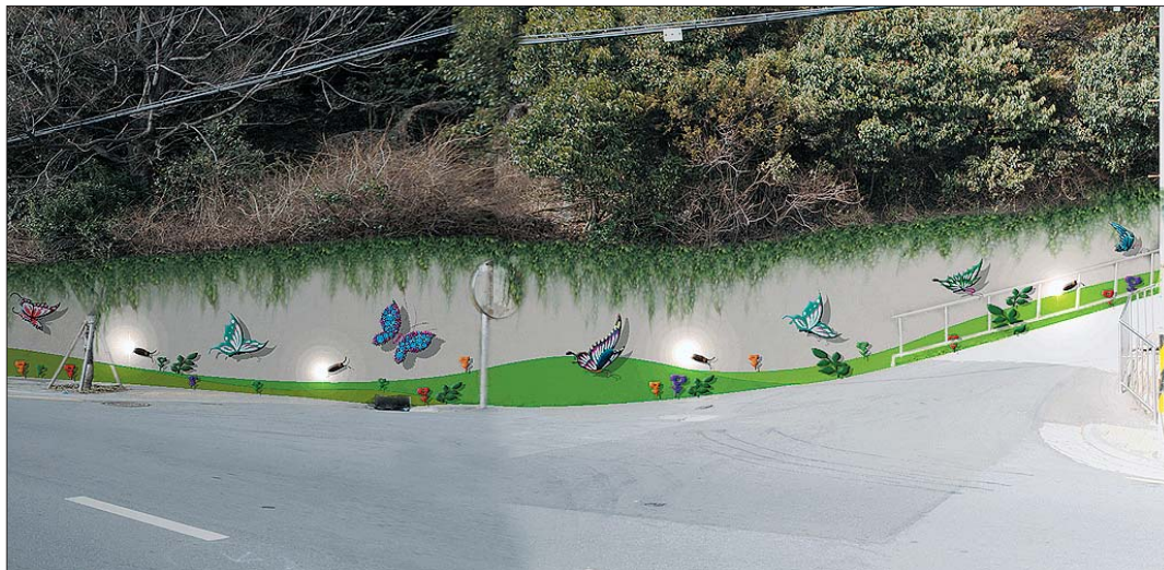
망양로 디자인거리 조성 사업이 착착 진행되고 있다. 나비 등 조형물을 설치하고, 야간경관 조명을 달고 나무를 심어 주변 경관을 아름답게 바꾸고 있다. 해광고등학교 방면과 대청공원 입구, 청운아파트 입구는 디자인거리 조성이 이미 완료되었다.