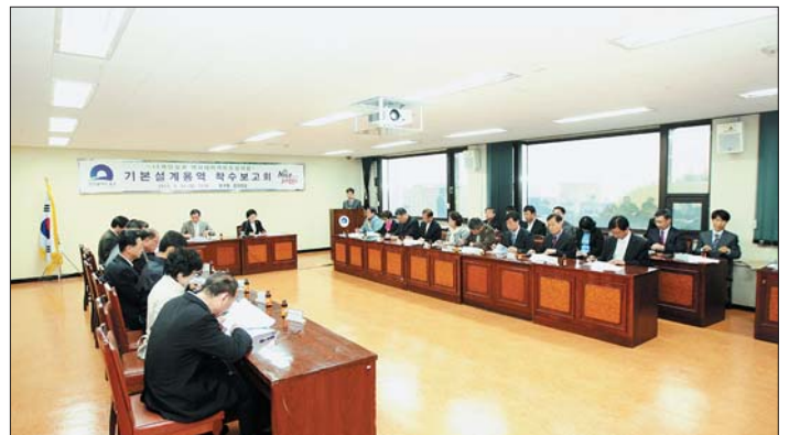
40계단 역사테마거리 기본설계용역착수 보고회가 백산로포럼과 지역 주민이 참석한 가운데 4월 26일 구청 중회의실에서 열렸다.