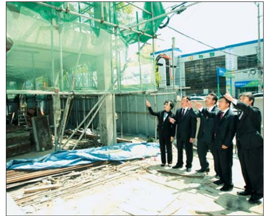
중구의회 의원들은 5월 6일 보수동책방골목문화관 건립 현장을 방문하였다.