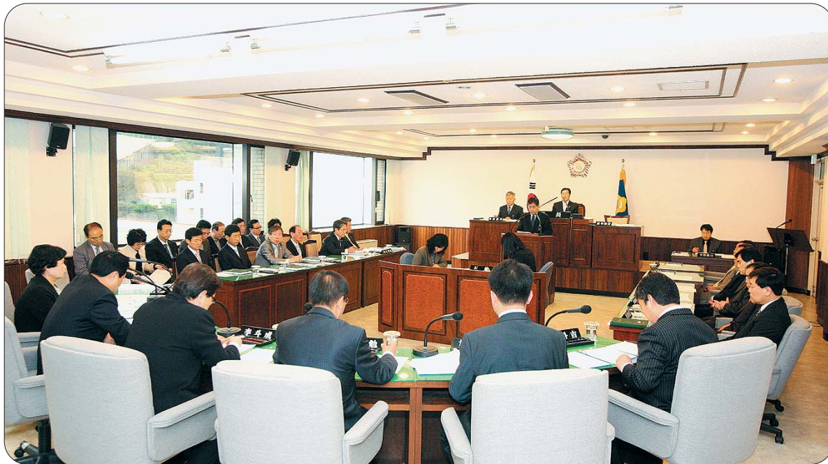
중구의회 의원들은 4월 30일 중구의회 본회의장에서 상정된 조례안 등을 심의 의결하고 있다.

제180회 중구의회 임시회가 4월 26일부터 30일까지 5일간의 일정으로 개최했다.