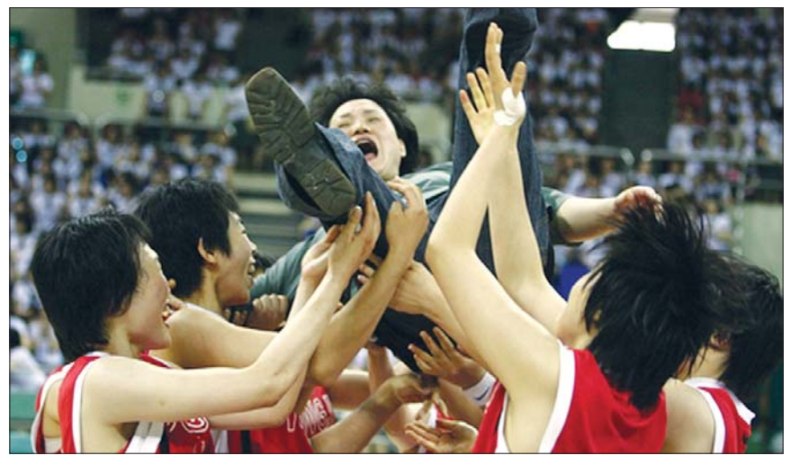
5월 6일~14일까지 열린 전국남여 중고농구대회에서 '준우승'을 차지한 동주여자고등학교 농구부.