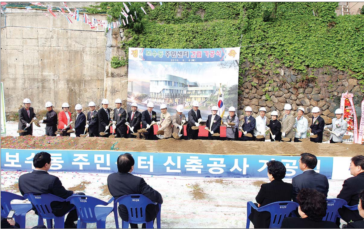
5월 6일 보수초등학교 뒤편 보수동 주민센터 건립 기공식에 참석한 주민들이 첫 삽을 뜨고 있다.

보수초등학교 뒤편 보수동 1가 48-3번지 부지에 들어설 '보수동 주민센터 건립 기공식'이 5월 6일 개최 되었다.